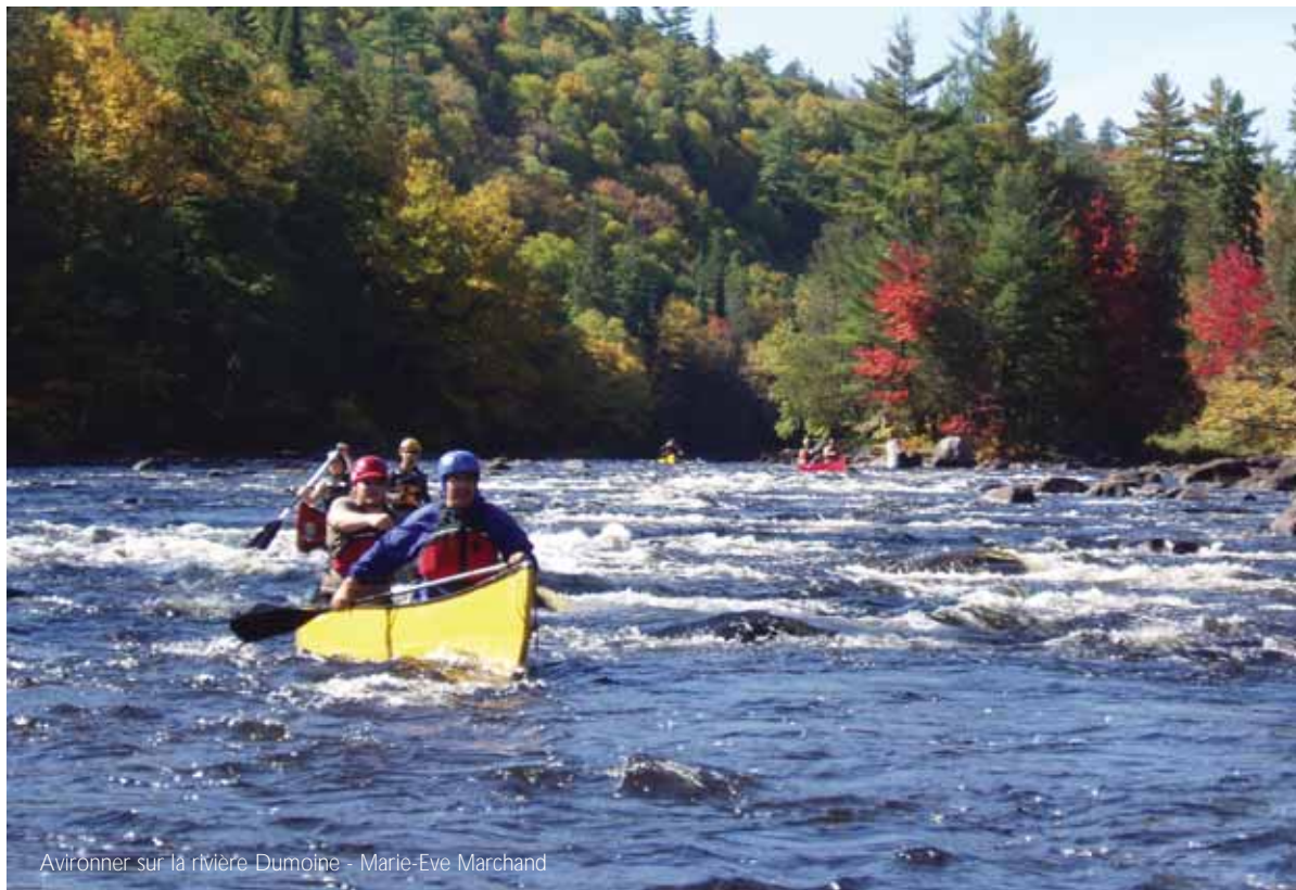
Avironner sur la rivière Dumoine - Marie-Eve Marchand

La SNAP recommande l'élargissement de la zone protégée afin de couvrir les deux tiers du bassin versant, soit environ 3 100 km 2 . La zone protégée élargie devrait inclure les sources des affluents de la rivière Dumoine, les forêts anciennes exceptionnelles qui se trouvent à proximité des limites actuelles et les sources des rivières voisines, comme les rivières Noire et Kipawa. 🌿