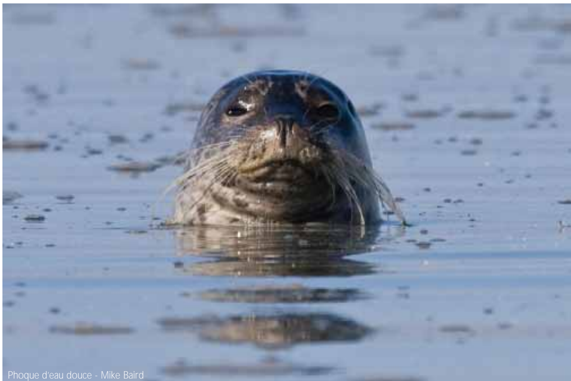
Phoque d'eau douce

4 Les parcs gérés par le gouvernement du Québec sont appelés « parcs nationaux » dans la province.