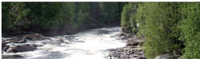
Rivière Nastapoka, QC - Brad Bassi Grande chute, rivière Dumoine, QC - SNAP – OV

Les biologistes, spécialistes en conservation, comprennent très bien maintenant que pour protéger efficacement l'intégrité de ces espaces, les parcs doivent être grands. Ils doivent être en réseau pour permettre la survie des populations sauvages et comporter d'autres caractéristiques écologiques comme de l'eau pure. Cela demande donc que les limites des parcs soient tracées en priorisant les besoins de la nature.